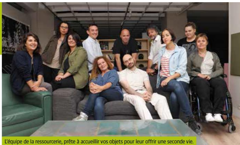
L'équipe de la ressourcerie, prête à accueillir vos objets pour leur offrir une seconde vie.

au 6 avenue de Rueil, est idéalement placé et sa superficie de 1 500 m 2 nous permet d'installer un atelier de valorisation et une boutique solidaire. Les Nanterriens pourront y déposer leurs objets et venir chiner des choses que nous aurons retapées. Pour ceux qui ne peuvent pas se déplacer, nous organiserons des collectes à domicile.