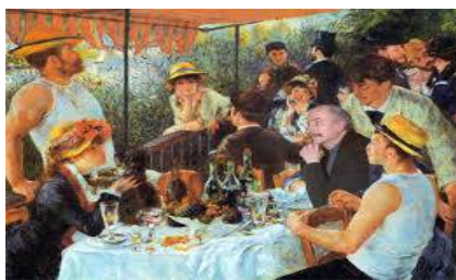
le déjeuner des canotiers Auguste Renoir Maison Fournaise

La mairie a présenté le 3-10-2014 un projet d'immeuble de 8 niveaux 2 rue des Martinets , devant l'ensemble H2O «ex ESSO » et à 100m du projet abandonné de TOUR de 130m !